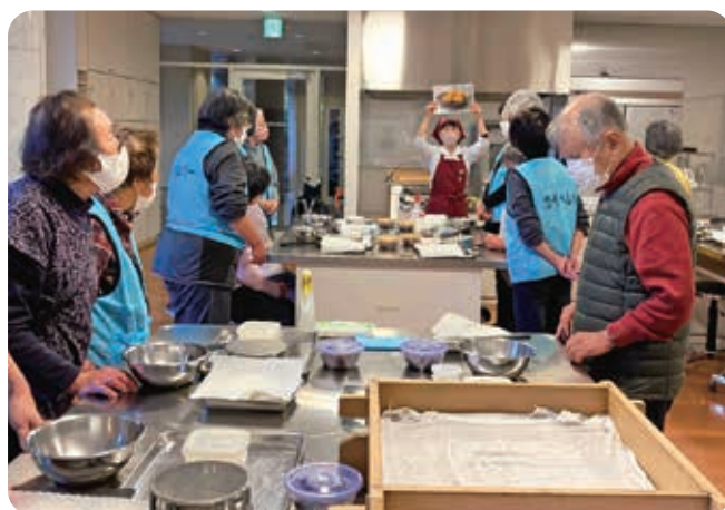
小野市視覚障害者協会／調理体験