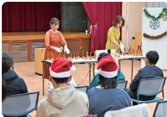
小野市ひまわり会／クリスマス会

日常生活援助等、住民自身がお互いに支えあうことで、解決できるニーズ(要望)に対し、小地域を単位とした「たすけあいシステム」をつくるため、推進町の指定を行いました。(67町)