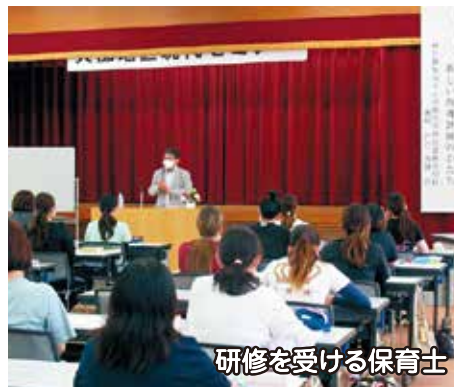
研修を受ける保育士