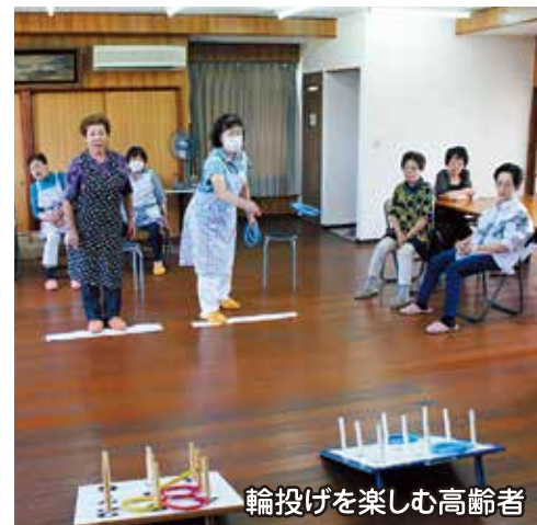
輪投げを楽しむ高齢者