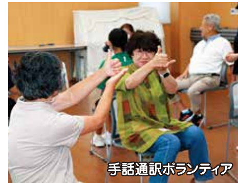
手話通訳ボランティア