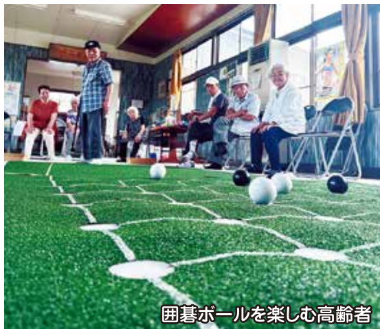
囲碁ボールを楽しむ高齢者