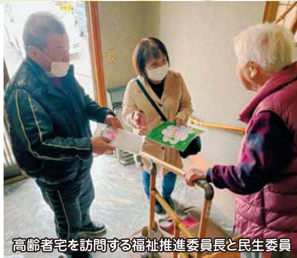
高齢者宅を訪問する福祉推進委員長と民生委員