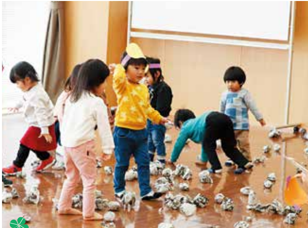
子育てサロンA(小野・小野東)

就園前の親子が地域で交流できる場づくりとして、子育てサロン・赤ちゃんサロンを開設しています。無料で参加できます。