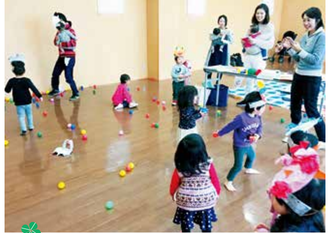
子育てサロンB(河合・市場・来住・大部・中番・下東条)