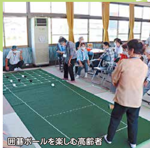
囲碁ボールを楽しむ高齢者