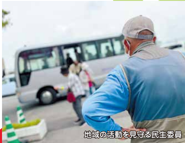
地域の活動を見守る民生委員

都道府県を単位にして行われており、各都道府県内で共同募金としてお寄せいただいたご寄付は、同じ都道府県内で、子ども達、高齢者、障がい者などを支援するさまざまな福祉活動や、災害時支援に役立てられます。