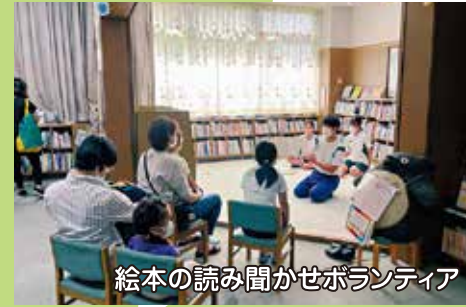
絵本の読み聞かせボランティア