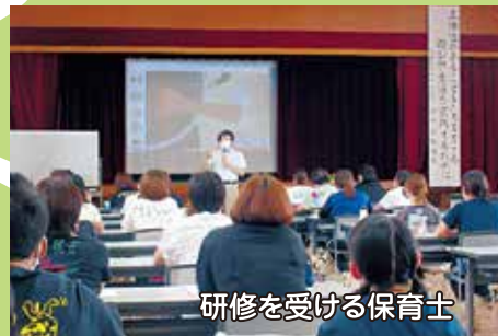
研修を受ける保育士