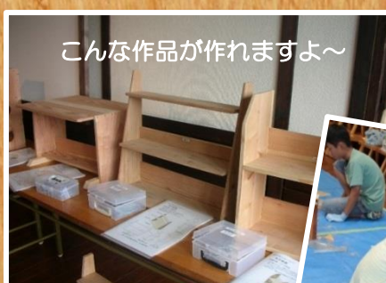
こんな作品が作れますよ～