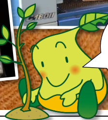
ぼくの イラストも 使ってね♪