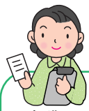
ケアマネージャー (ケアマネ)