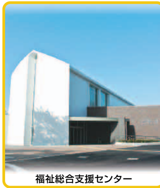
福祉総合支援センター

昨年、歳末たすけあい募金(期間12月1日～12月31日)にご協力いただき、厚くお礼申し上げます。 集まった3,733,800円は、歳末見舞金贈呈事業、年末年始ふれあい事業等に活用いたしました。社協が推進している福祉活動についてご理解いただき、今後ともご協力よろしくお願いいたします。