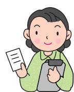
ケアマネージャー (ケアマネ)