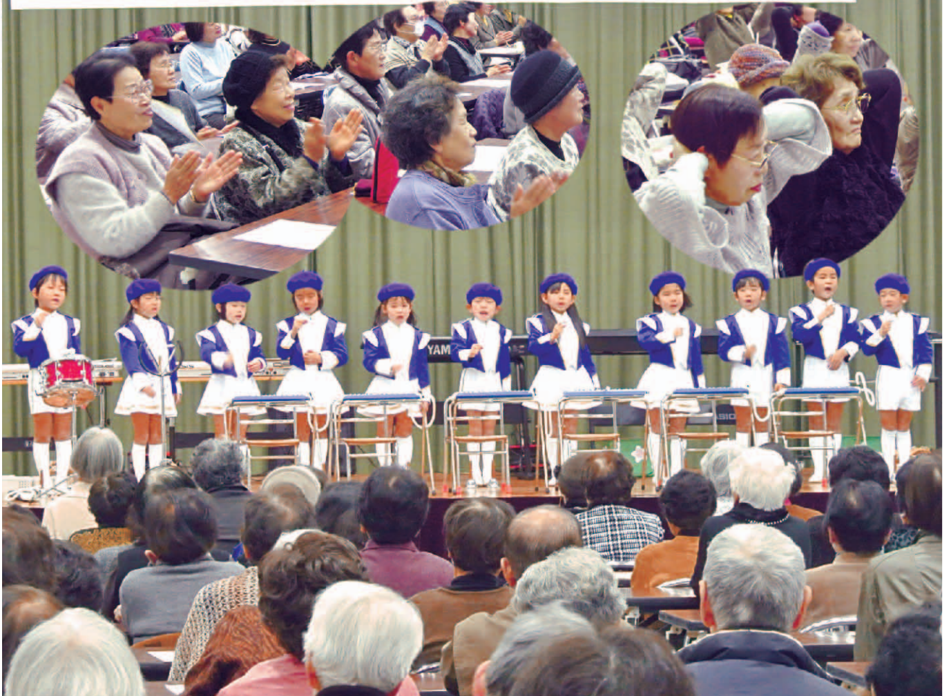
昨年のひとり暮らし高齢者のつどい