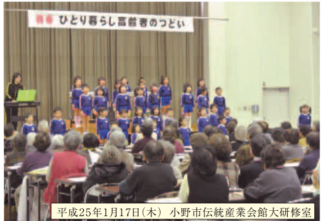
平成25年1月17日(木) 小野市伝統産業会館大研修室